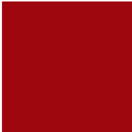
Rubinrot RAL 3003 Farbcode .04