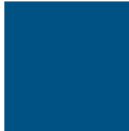
Signalblau RAL 5005 Farbcode .06